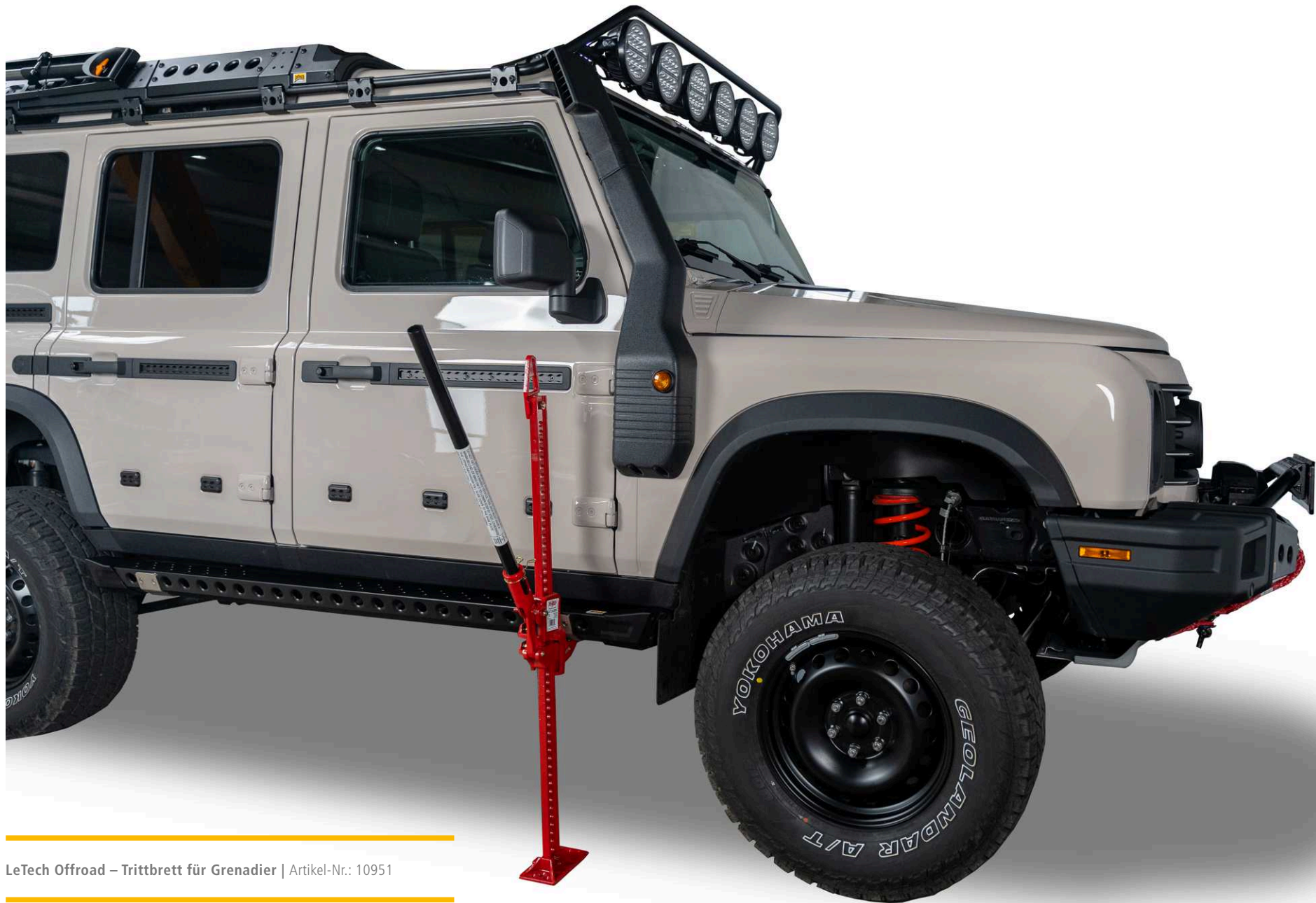
LeTech Offroad – Trittbrett für Grenadier | Artikel-Nr.: 10951