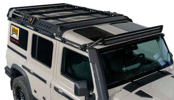
LeTech Scheinwerfbügel Light Bar für Grenadier | Artikel-Nr.: 11080 LED Light Bar 50" | Artikel-Nr.: 11072